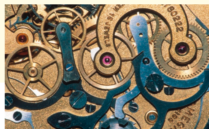
Bilder: (von links im Uhrzeigersinn) Börse Zürich; Medizintechnologie in Basel; Uhrenindustrie in Bern; Autosalon Genf