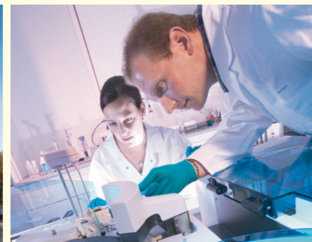
Die Wirtschaftszentren Zürich, Basel, Bern und Genf stärken mit ihren Kernkompetenzen den Unternehmensstandort Schweiz und sind gleichzeitig Magnet für ausländische Firmen.