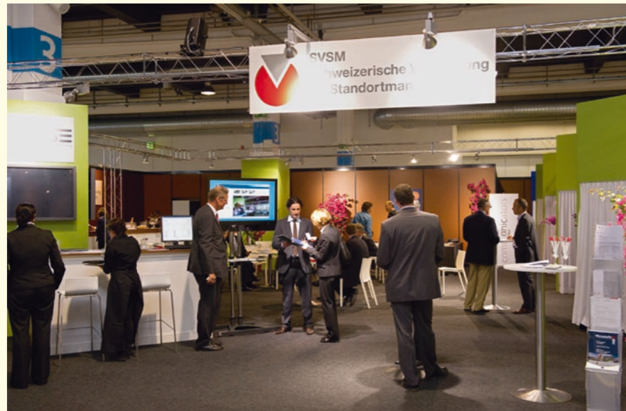
Die Messe: Marktplatz der Begegnungen und Nährboden für Unternehmenserfolg. Die Anleitung dazu vermittelt die SVSM-Academy vom 24. Februar.